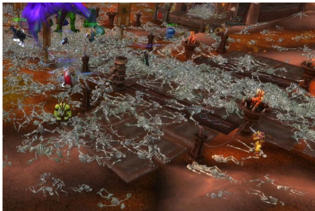
Figura 1. Captura de pantalla de World of Warcraft durante el episodio corrupted blood del año 2005.

Los cadáveres se amontonan en las plazas centrales de varios de los pueblos más importantes. Súbitamente, la salud de muchos empeora hasta la muerte sin alguna causa explicable. Luego de un tiempo, se comprende que las montañas de esqueleto son producto de un virus que empezó en las mazmorras y que se descontroló porque personajes no humanos, como mascotas, sirvieron como ruta de salida del virus fuera del entorno controlado de esas mazmorras. Rápidamente, el virus se propaga. Las autoridades emiten un comunicado donde decretan una cuarentena voluntaria para que las personas no visiten los pueblos y para que eviten desplazarse. Sin embargo, muchos curiosos se acercan para deleitarse con la escena de los cadáveres amontonados; algunos se infectan y pagan con su vida el precio de la curiosidad.