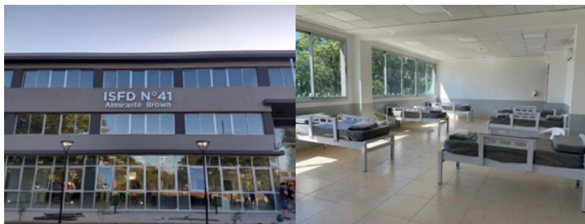
Figuras 2 y 3. ISFD N° 41 transformado en hospital de emergencia.

Adjuntamos dos fotos que, de algún modo, condensan la dramaticidad del momento que vivimos: son de un edificio que iba a inaugurarse el 30 de marzo para el ISFD N° 41, construido por el Municipio de Almirante Brown. Ante la emergencia sanitaria fue transformado en un hospital para alojar a pacientes con covid-19. Una imagen es del frente, la otra del espacio que estaba destinado a funcionar como aula.