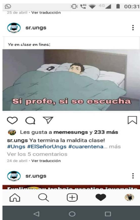
Figura 1. Meme elaborado por estudiantes de la UNGS.

Efectivamente, luego de una primera etapa de adaptación a la novedad, de entusiasmo por preservar el contacto, la relación, el vínculo –o, mejor dicho, por sostener una conversación, tal como planteó Inés Dussel (2020) en un webinar organizado por el Instituto Superior de Estudios Pedagógicos de Córdoba que logró una enorme circulación; posiblemente porque brindó pistas y guías allí donde casi nadie sabía cómo moverse–, se percibe cierto cansancio y estancamiento en las dinámicas.